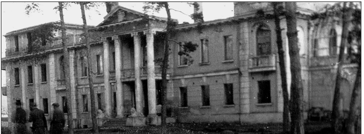
Дом Н. Ребиндера в Шебекино. 1950-е гг.

Малая скульптура типичных рабочих поселков Российской империи зарождается на рубеже XIX – XX веков. Ведет она свое начало от практически повсеместно производимого в это время расширения дворянских имений или их перестройки в связи со сменой и обогащением архитектурных стилей. Так, поселок Шебекино после перестройки усадьбы местных землевладельцев Ребиндеров в 1913-1915 гг. обзавелся садово-парковым комплексом с беседками, чугунными скамьями, небольшими статуями, стилизованными фонарями и фонтаном. Бронзовые скульптуры лежащих львов встречали у входа в один из домов, принадлежащего предводителю дворян Харьковской губернии Николаю Ребиндеру [7: 304].