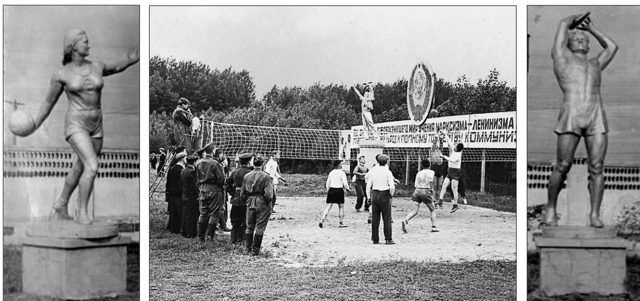
Стадион «Пищевик». Шебекино, 1950-е гг.

Так, с большой любовью и желанием показать красоту советского человека был скульптурно обустроен в 50-х годах стадион «Пищевик» г. Шебекино [4]. Страна, которая только-только затянула раны после войны, бросив все силы на восстановление промышленности, старалась в то же время украсить и жизнь простого обывателя, запечатлеть лучшие его достижения в скульптуре.