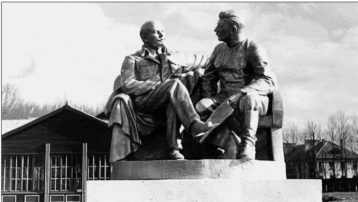
Памятник В.И. Ленину и И.В. Сталину в г. Шебекино. 1950-е гг.

С присвоением Шебекино статуса города в 1938 году, постройкой неременного атрибута – Дома Советов – начинается целая эпоха бронзовых и гипсовых Лениных, Сталиных, Марксов и Энгельсов в самых важных местах молодого города. Так городская скульптура, служившая ранее средством оживления архитектурного пространства, берет на себя новую и важную функцию – идеологическую. С ней она прошагает почти семьдесят лет, полностью подчиняясь ей, рождая новые формы выражения идеологической мысли.