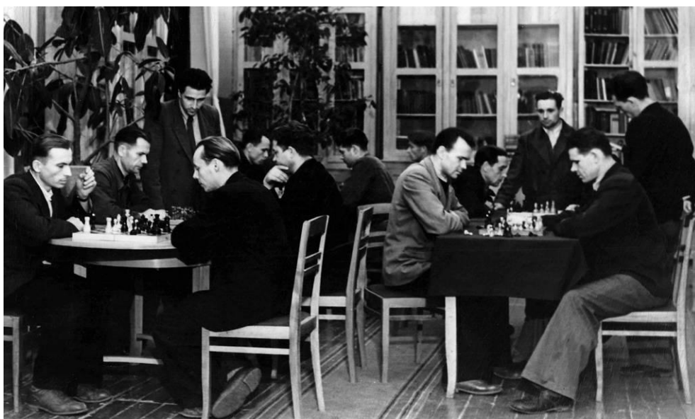
Красный уголок клуба химкомбината. Соревнования по шахматам. Шебекино, 1950-е гг.

Одним из самых популярных мест проведения досуга и отдыха был клуб химкомбината. В 1953-1954 гг. для него были приобретены новый комплект оркестра духовых инструментов, большое количество спортивного инвентаря, костюмы для хорового коллектива, бильярд, пополнилась клубная библиотека. При клубе работало 8 самодеятельных кружков, в которых участвовало свыше 120 человек. Более 40 человек состояло в хоровом коллективе, 48 работников треста «Жирстрой» и домохозяек занимались в кружке кройки и шитья. В середине 1950-х гг. в клубе ежегодно проходило свыше 50 вечеров, концертов и спектаклей, на которых присутствовало около 10 тыс. человек [14]. Выступали здесь и коллективы из других городов и даже стран, например, в 1953 г. на шебекинской сцене выступили китайские артисты Ван Тентау и Сяо Дин-лин.