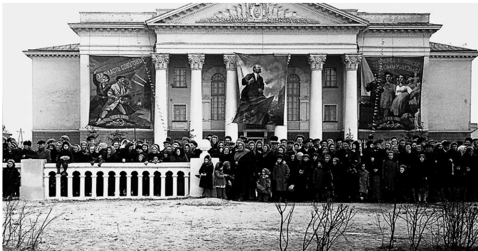
Ноябрьская демонстрация у Дворца культуры «Химик». Шебекино, середина XX в.

ненных в самых разных жанрах: художественная вышивка, вязание, филейные работы, рисунок, резьба по дереву, швейные изделия. Авторами были люди самых разных возрастов и профессий – работники предприятий и учреждений, домохозяйки, колхозницы, пенсионеры, школьники. Лучшие работы были отправлены на областную выставку изобразительного искусства.