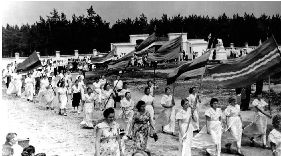
Пятый районный фестиваль молодежи на стадионе «Химик». Шебекино, 1958 г.

Сводный хор района из 500 человек исполнил песню «Славься советская наша держава». На сцене летнего кинотеатра выступили участники художественной самодеятельности – солисты, плясуны, чтецы. Рядом работала танцевальная площадка. На стадионе химкомбината прошли спортивные соревнования по разным видам спорта – легкой атлетике, метанию ядра, волейболу, поднятию штанги. На стадионе машзавода команда предприятия встретилась с украинской командой «Спартак». Вечером на сцене клуба химкомбината выступил творческий коллектив завода [4].