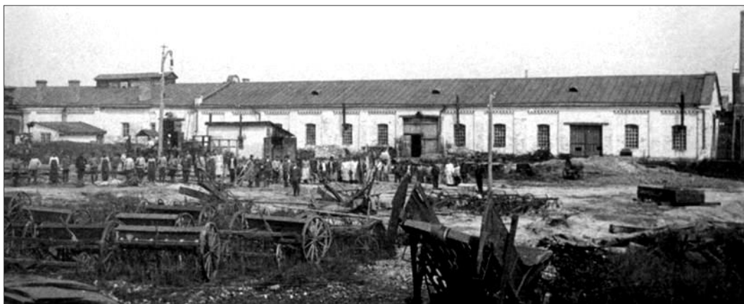
Механические мастерские. Шебекино, 1913 г.

Земли Ребиндеров располагались в Белгородском и Волчанском уездах и насчитывали 17,5 тыс. десятин (ок. 19000 га), еще 5 тыс. десятин семья арендовала у других владельцев 1 . Все земли были объединены в 12 экономий, каждая являлась специализированным хозяйством. В них выращивали свекловичу – сырье для сахзавода, занимались скотоводством, разведением домашней птицы, вели зерновое и лесное хозяйство, садоводство, пчеловодство, ремесленное производство. В хозяйстве имелись также сахарный, винокурный и кирпичный заводы, механические мастерские, водяная мельница. В 1905 г. А. Ребиндер построил в Шебекино электростанцию, которая обеспечивала энергией предприятия и жилые дома.