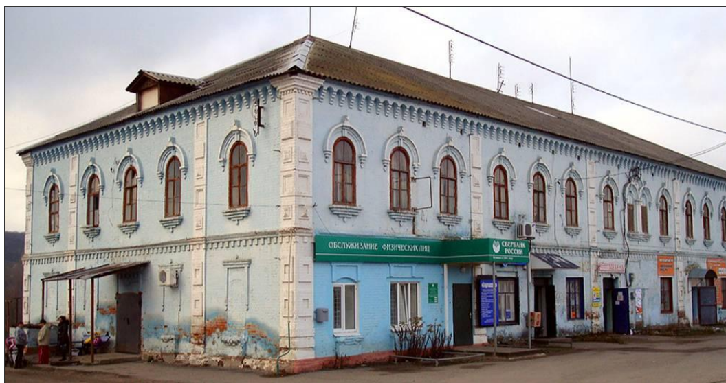
Здание казармы для рабочих Ново-Таволжанского сахарного завода. 2009 г.

При заводе было построено 27 семейных домов для служащих и старших мастеровых. Каждый дом имел несколько комнат, кухню, погреб и сарай для скота. Отапливались дома каменным углем и дровами, которые предоставлялись бесплатно. Имелись электричество и водопровод, воду брали из артезианского колодца. Для неженатых и сезонных работников была построена казарма на 160 коек. На первом этаже находились спальни, столовые, кухни, второй предназначался для отдыха. В одной из комнат был устроен бильярд, газеты и журналы для чтения. Рядом располагался комплекс театральных помещений с электротеатром.