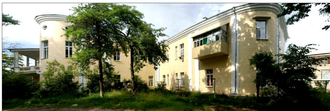
Дом А.А. Ребиндера (сейчас – жилой дом). Шебекино, 2013 г.

1) дом А.А. Ребиндера. Дома Ребиндеров размещались недалеко от центральной площади Шебекино. Они стояли рядом: дом Николая – напротив центральных ворот (разрушен в годы войны); дом Мансуровых – справа, над рекой у моста (в советское время к нему с двух сторон были сделаны пристройки, сейчас это городская школа № 3); дом Александра стоял слева. В начале 1915 г. он был перестроен по проекту шебекинского архитектора Н.М. Михайлова. Новое здание было выполнено в стиле «модерн», без претенциозных архитектурных украшений; его отличительной чертой является полукруглая башня в северной части и веранда на втором этаже. После революции здесь размещалась городская школа, сейчас здание используется под жилой дом. В советское время в его архитектуру были внесены изменения: заложена часть окон, проделаны дополнительные дверные проемы, переделан центральный вход и др.