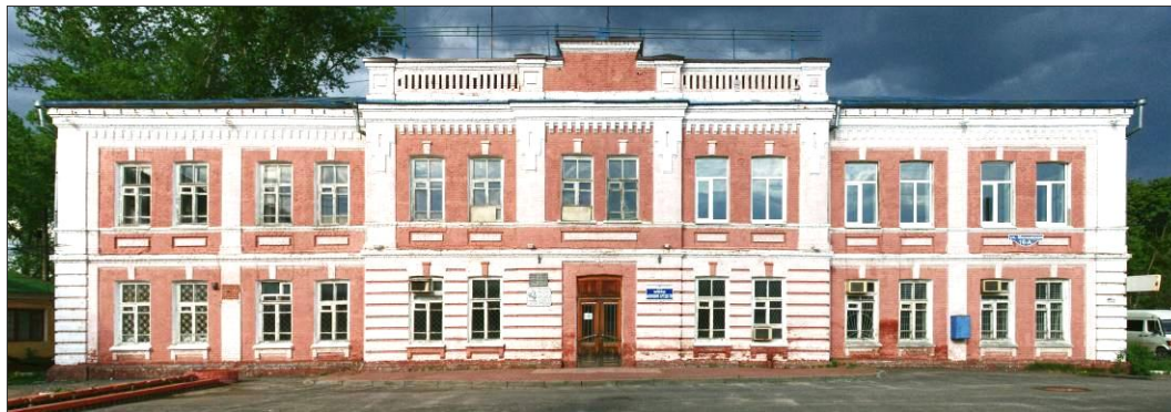
Контора Алексеевского сахарного завода. Шебекино, 2011 г.

4) контора Алексеевского сахзавода. Была построена в 1914 г., на оборотной стороне фасада сохранилась рельефная надпись. Обращает на себя внимание кирпичная отделка здания, фронтон с балюстрадой. После войны здесь размещалось заводууправление Шебекинского химкомбината.