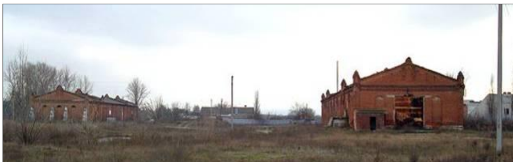
Сахарные склады Ново-Таволжанского сахарного завода. 2009 г.

Кроме этих объектов в Новой Таволжанке сохранились несколько домов для служащих, училище (временно используется под церковь), казарма для рабочих с электротеатром (сейчас – сельский клуб, ведется реконструкция) и два склада вне заводской территории. Дом Боткиных в советское время был, увы, утрачен.