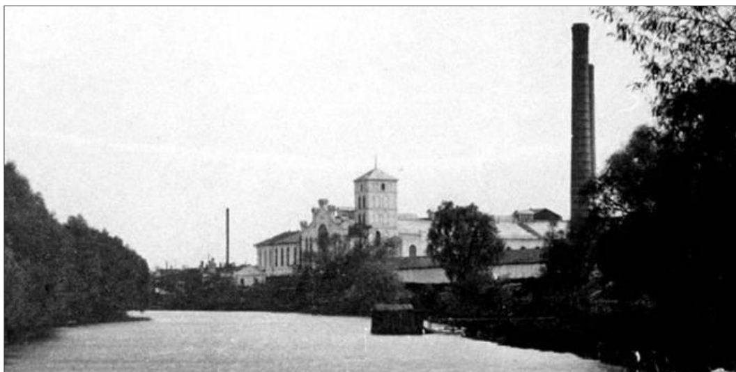
Алексеевский сахарный завод. Шебекино, 1913 г.