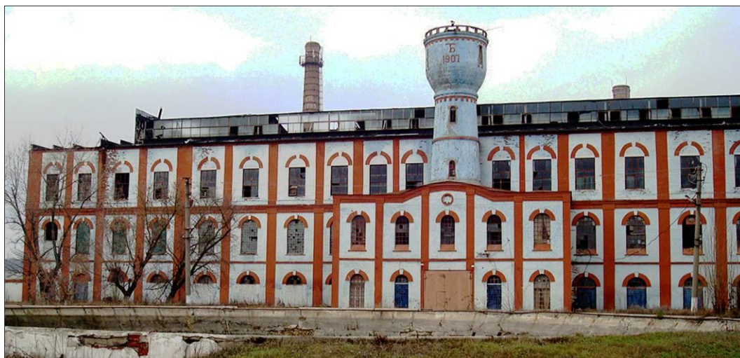
Главный корпус Ново-Таволжанского сахарного завода. 2009 г.

1) главный производственный корпус Ново-Таволжанского сахарного завода. Первый этаж – очень высокий с красивыми арочными окнами. Над входом высится водонапорная башня с рельефными цифрами «1907» и монограммой Боткиных. Прежде, когда здание было двухэтажным 2 , башня красиво выделялась на фоне неба, но в 1980-х гг. был надстроен третий этаж, и этот эффект оказался утрачен.